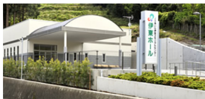
伊東ホール（伊東市吉田）