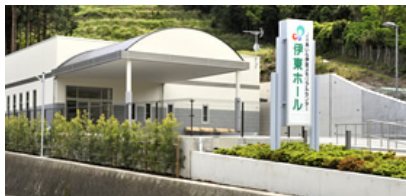
伊東ホール（伊東市吉田）