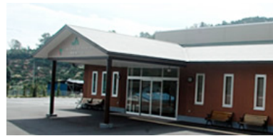
宇佐美ホール（伊東市宇佐美）