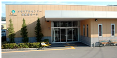
南熱海ホール（熱海市下多賀）

葬祭や初盆・法事等、葬祭に関する一切の業務を取り扱っております。熱海と伊東、それぞれのメモリアルセンターを用意しており、組合員や利用者のニーズに合った幅広いサービスの提供を行っています。