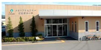
南熱海ホール（熱海市下多賀）

葬祭や初盆・法事等、葬祭に関する一切の業務を取り扱っております。熱海と伊東、それぞれのメモリアルセンターを用意しており、組合員や利用者のニーズに合った幅広いサービスの提供を行っています。