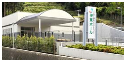
伊東ホール（伊東市吉田）