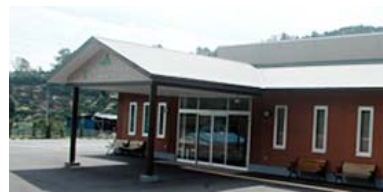
宇佐美ホール（伊東市宇佐美）