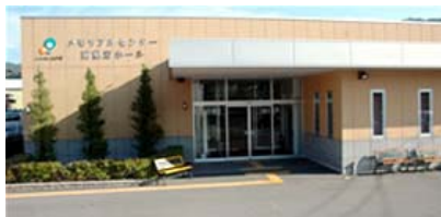
南熱海ホール（熱海市下多賀）

葬祭や初盆・法事等、葬祭に関する一切の業務を取り扱っております。熱海と伊東、それぞれのメモリアルセンターを用意しており、組合員や利用者のニーズに合った幅広いサービスの提供を行っています。