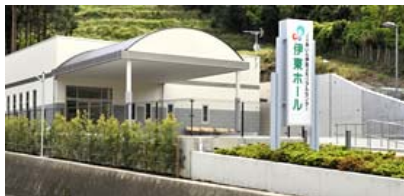
伊東ホール（伊東市吉田）